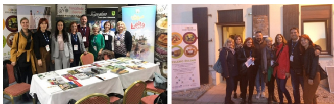
20. poslovno turistična borza PUT 14.11.-16.11.2018