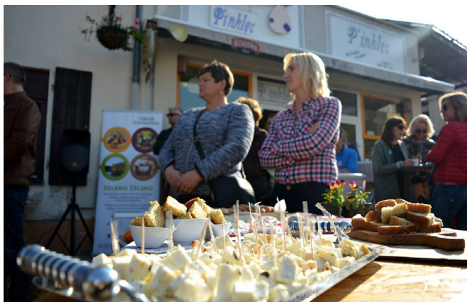
1. dogodek: Odprtje predstavitvenega prostora KULTNATURA, 13. 10. 2018. / 1. dogaja: Otvorenje prezentacijskega prostora Kulturnatura, 13.10.2018.

Izvedli smo 5 dogodkov, kjer je sodelovalo skupno 5407 udeležencev. Dogodki so obogatili turistično ponudbo, usmerjeni pa so bili na dvig števila obiskovalcev na kulturno in nesnovno dediščino Varaždina.