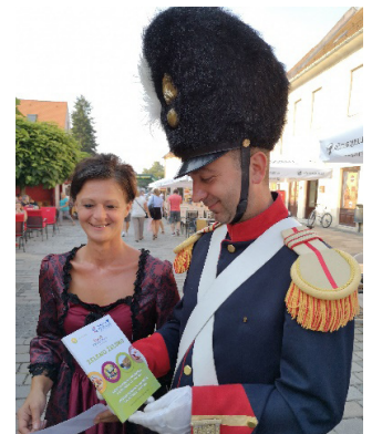
5. dogodek: Gastro košara varaždinskega okraja, 28. 8. 2019. / 5. dogaja: Gastro košara varaždinskega kraja 28.8.2019.

Za predstavnike turistične stroke, medijev in lokalnih oblasti smo organizirali 3 strokovne izlete, kjer smo testirali nekaj od 20 razvitih turističnih programov.