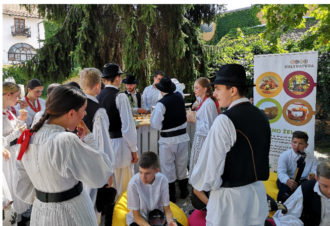
3. dogodek: Zeleno želimo na Festivalu varaždinskih dvorišč, 6. in 7. 7. 2019. / 3. dogaja: Zeleno želimo na Festivalu varaždinskih dvorišta, 6. i 7.7.2019.