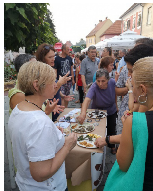
4. dogodek: Zeleno želimo na Špancirfestu, 23. 8. 2019. / 4. dogaja: Zeleno želimo na Špancirfestu – 23.8.2019