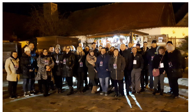
2. dogodek: Zeleno želimo na Adventu v Varaždinu, 8. 12. 2018. / 2. dogaja: Zeleno želimo na Adventu v Varaždinu, 8.12.2018.

Održano je 5 događanja na kojim je ukupno prisustvovalo 5407 sudionika. Događanja su obogatila turističku ponudu a ujedno utjecala na povećanje posjete kulturno povijesnoj baštini grada Varaždina.